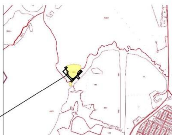
СХЕМА РАСПОЛОЖЕНИЯ ОБРАЗУЕМЫХ ЗЕМЕЛЬНЫХ УЧАСТКОВ НА КАДАСТРОВОЙ КАРТЕ

В соответствии с кадастровым планом территории на проектируемой территории имеется охранная зона нефтепровода сборного скв 16 - АГЗУ 378 (инв. №5813540) ПАО "АНК "Башнефть" (высостройный номер 0258-6-653). В соответствии с инженерно-геодезическими изысканиями, выполненными МУП ЧАУГ по Ишимбайскому району в 2022 году, данный нефтепровод отсутствует.