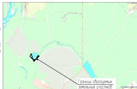
СХЕМА РАСПОЛОЖЕНИЯ ОБРАЗУЕМЫХ ЗЕМЕЛЬНЫХ УЧАСТКОВ